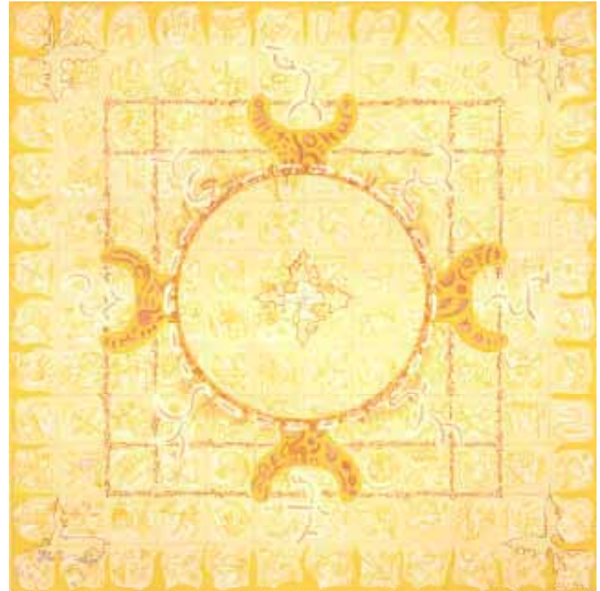
Aladnam der vier Winde 120 x 120 cm