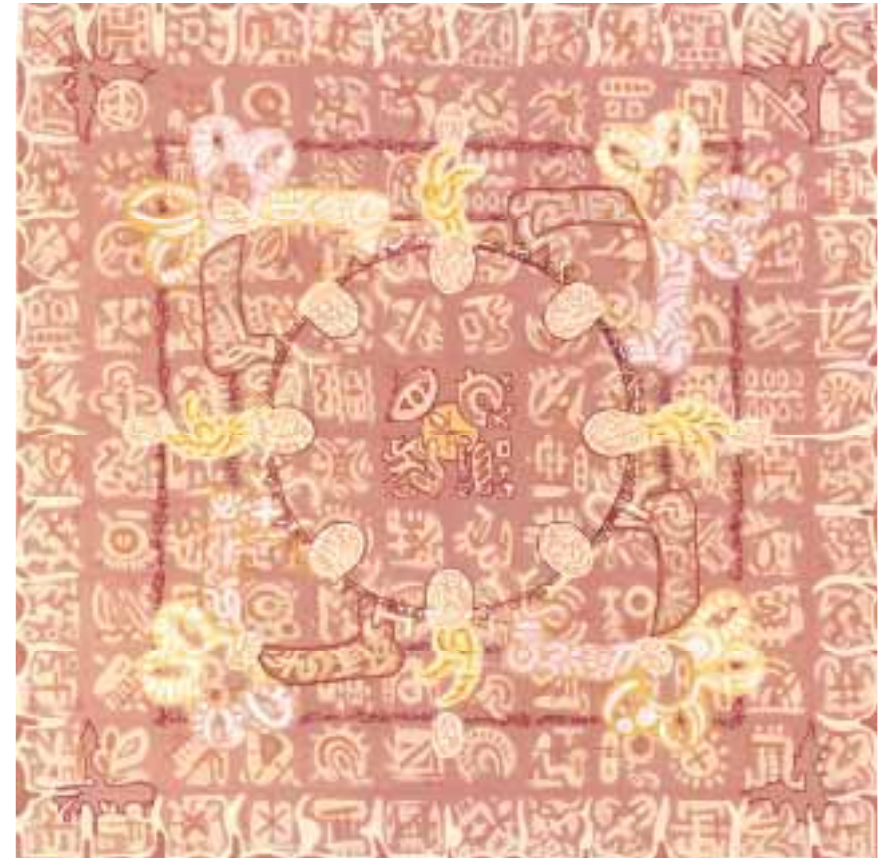
Aladnam der Knochen 120 x 120 cm