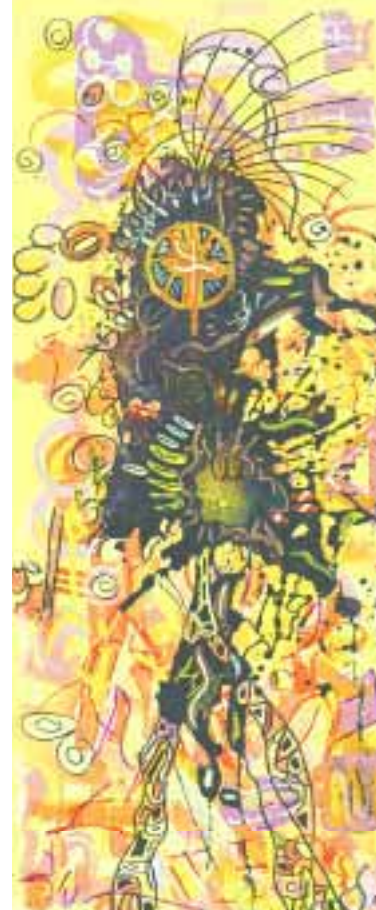
Takuba 20 x 50 cm