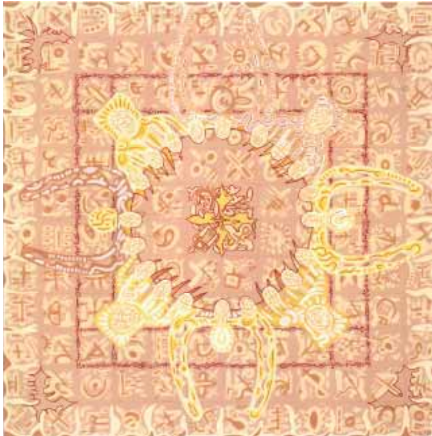
Aladnam der Jäger 120 x 120 cm