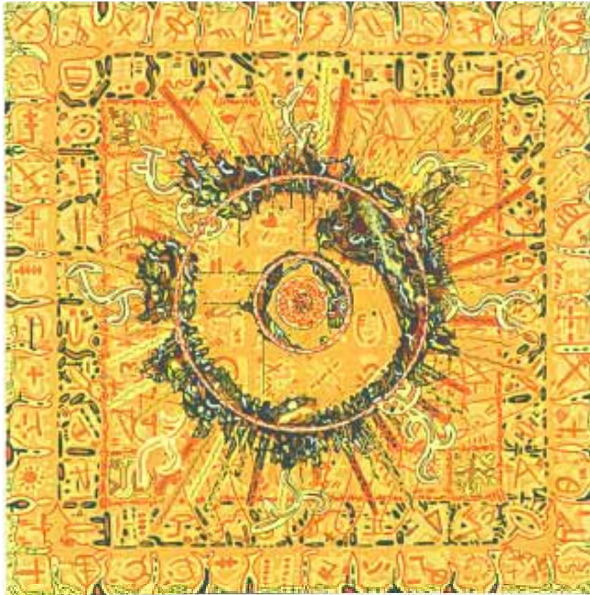
Aladnam des Sundra 120 x 120 cm