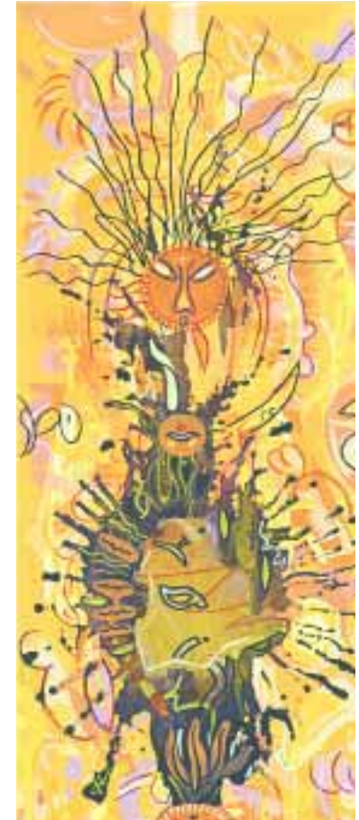
Königin, du mußt nicht traurig sein 20 x 40 cm