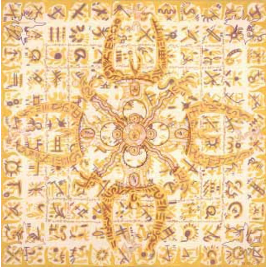
Aladnam des Nomadensterns 120 x 120 cm