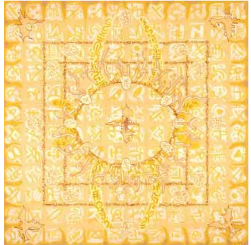
Aladnam des Spinnei 120 x 120 cm