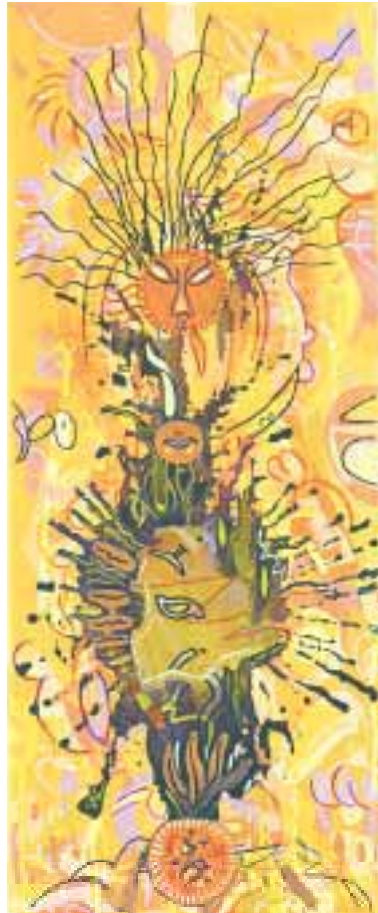
Kadu 20 x 50 cm