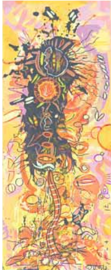
Sonnenbaum 20 x 50 cm