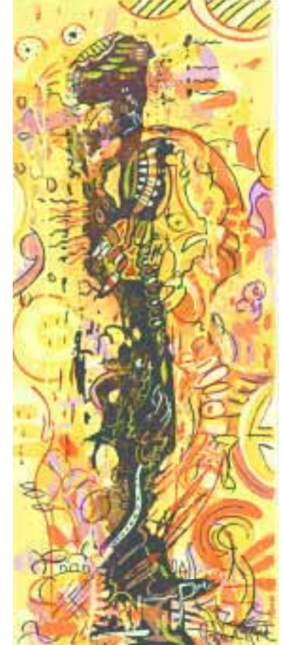
In der Oase 20 x 50 cm