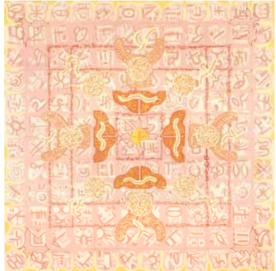
Aladnam der acht Fürsten 120 x 120 cm