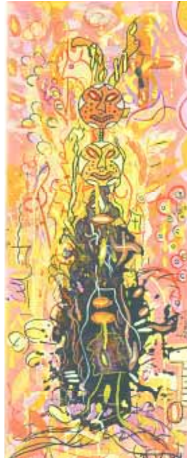
Doppelkopf- Der Totenwächter 20 x 50 cm