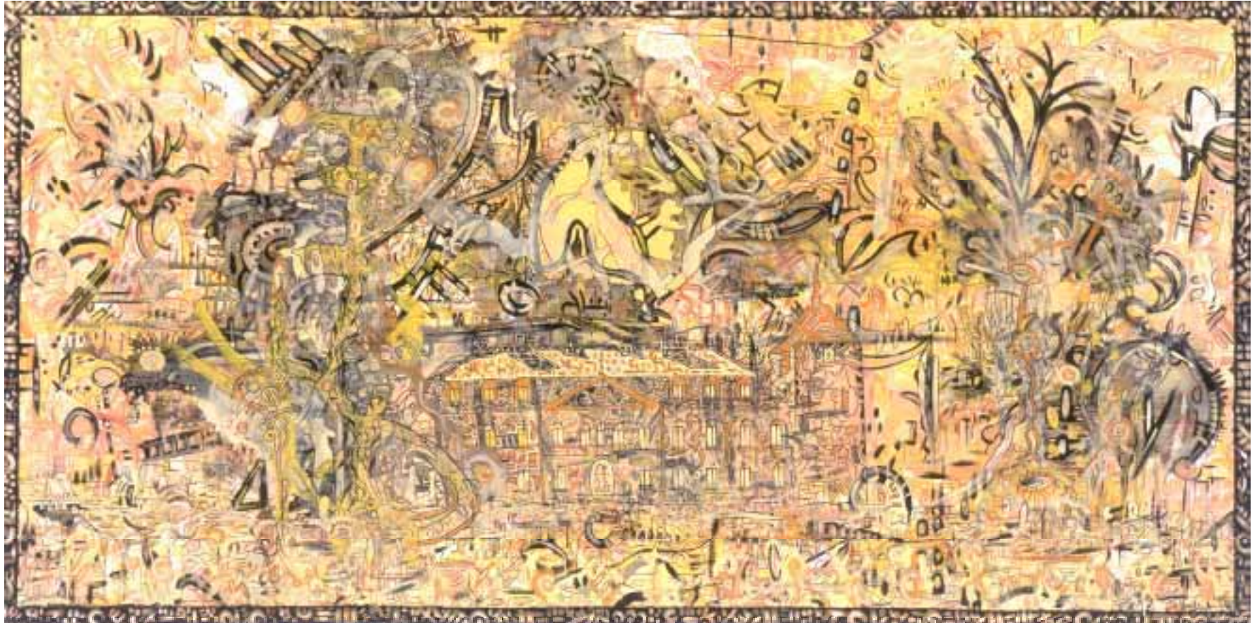
Istana Kraton - Haus der Freunde 240 x 120 cm