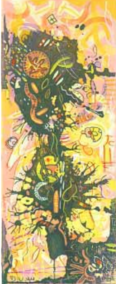
Spuren 20 x 50 cm