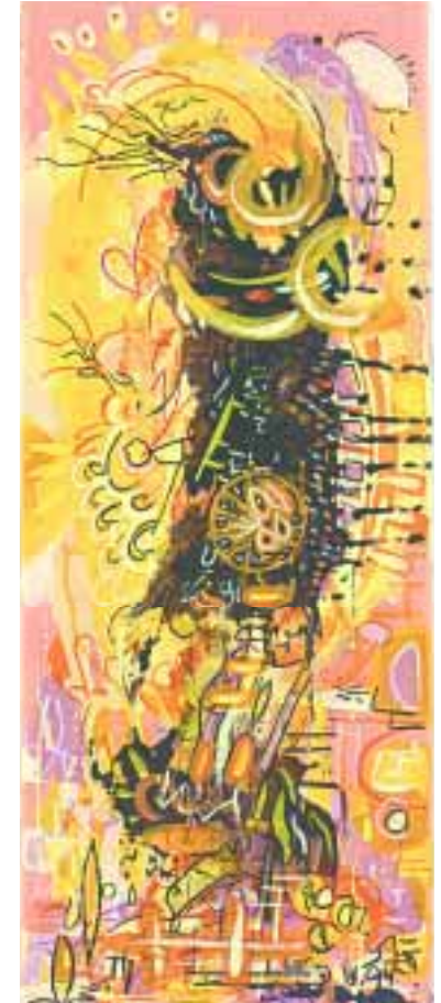
Im Laufe der Zeit 20 x 50 cm