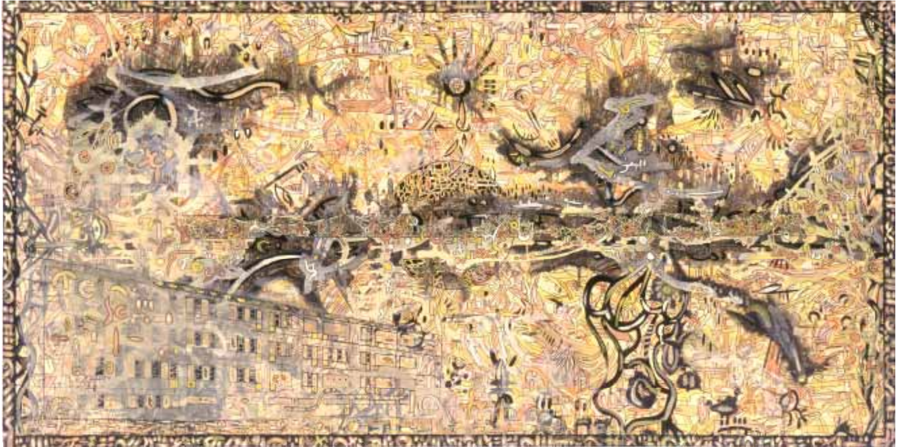
Alam Baka Saray - Haus der Toten 240 x 120 cm