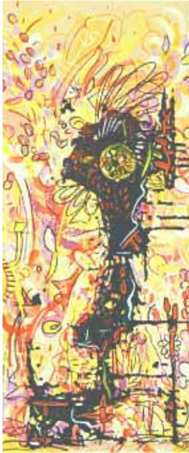
Am Schwarzkopf 30 x 60 cm