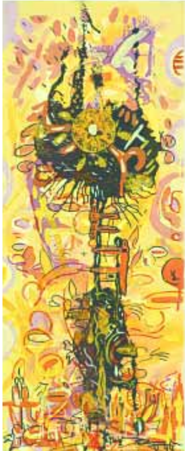
In der Oase 20 x 50 cm