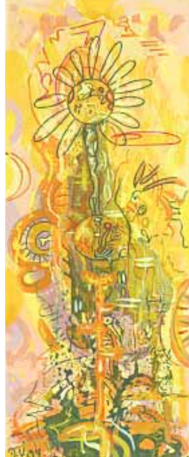
Wüstenblume 20 x 50 cm