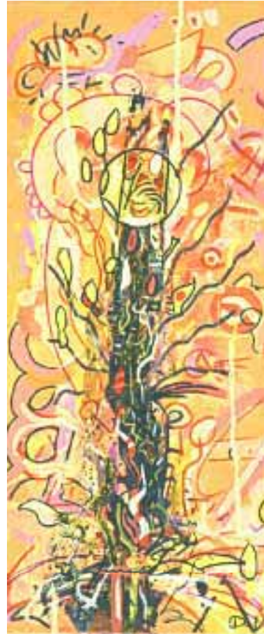
Stone Tree 20 x 50 cm