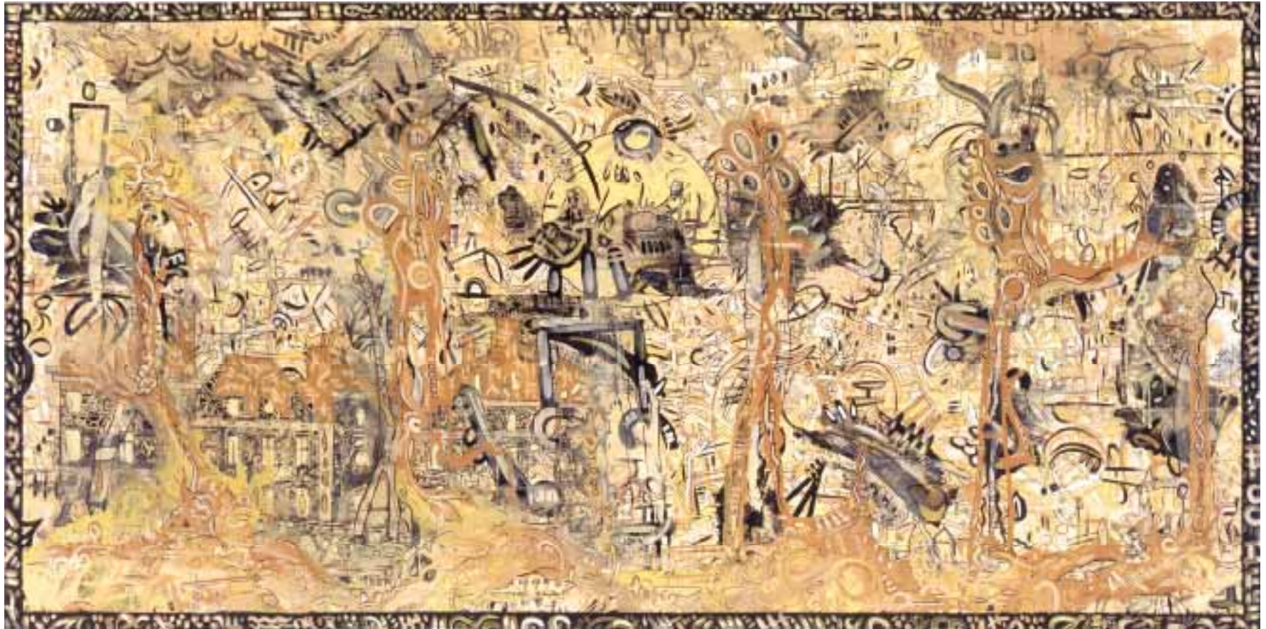
Fateh - In der Oase des Sonnenschlosses 240 x 120 cm