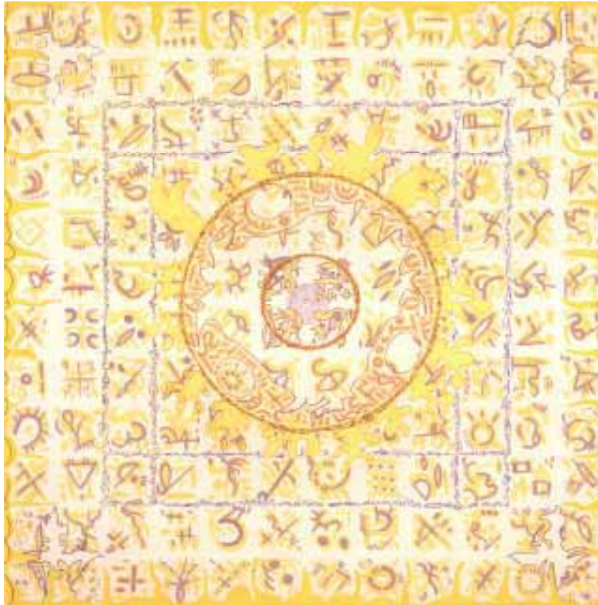
Aladnam des Ringschei 120 x 120 cm