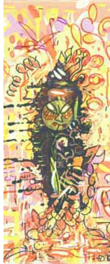
Felsengeist 20 x 40 cm