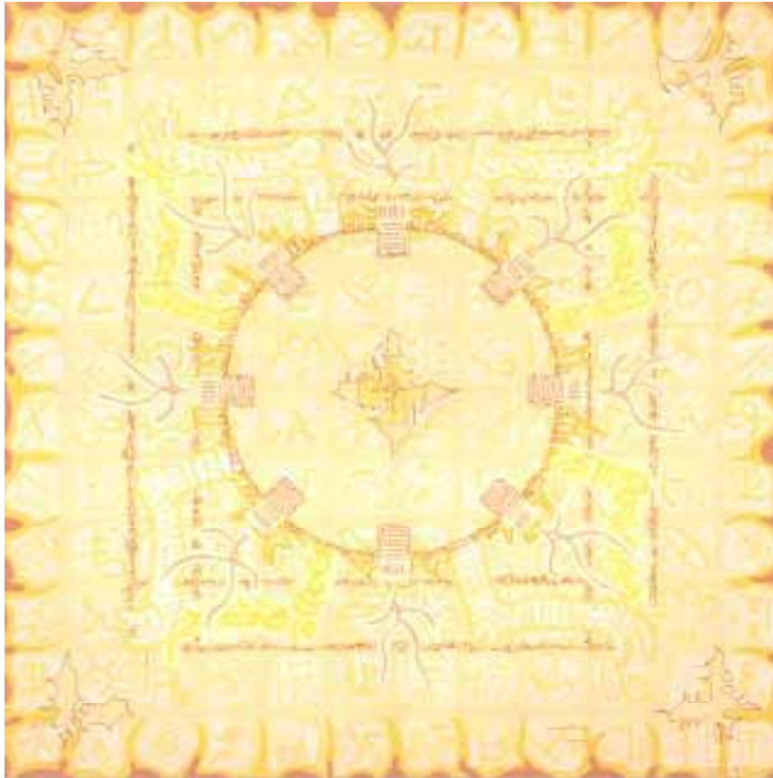
Aladnam der Kr euzsonne 120 x 120 cm