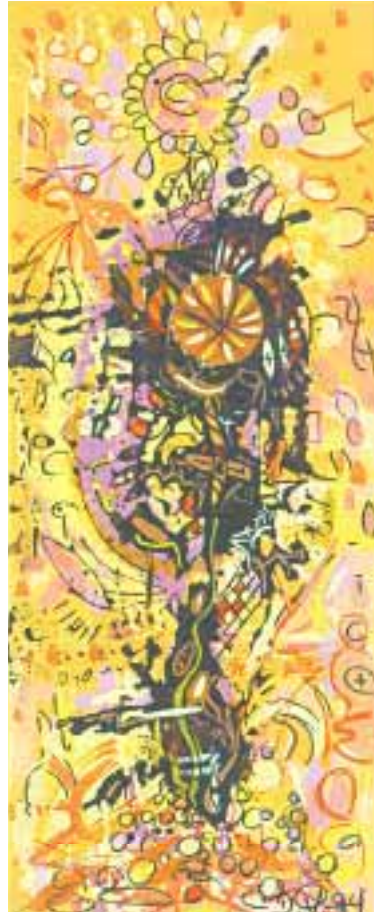
Der Sonne mußst Du folgen 20 x 50 cm