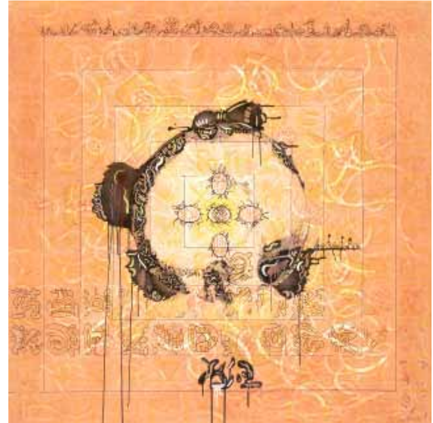
Das Rätsel der schwarzen Sonne 120 x 120 cm