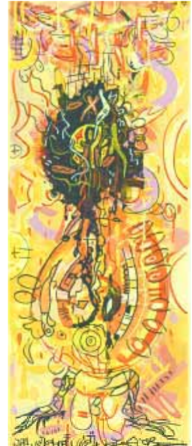
Kriegsgeist 20 x 50 cm