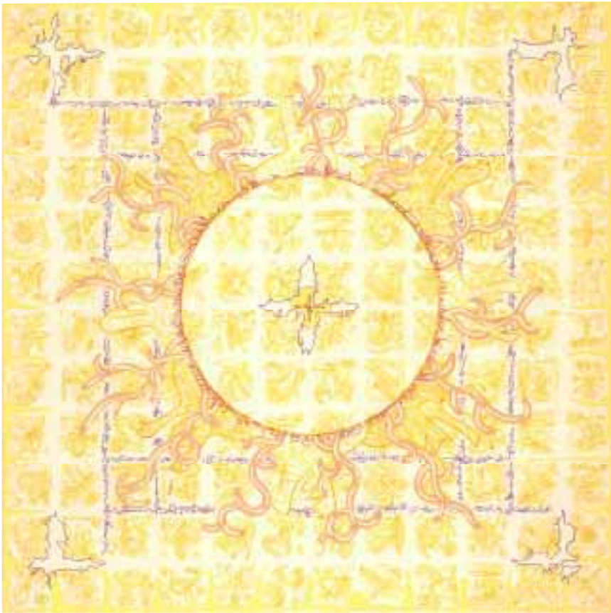
Aladnam der acht Winde 120 x 120 cm