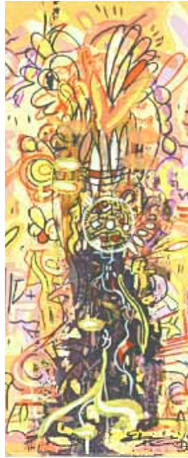
Der Keim 20 x 50 cm