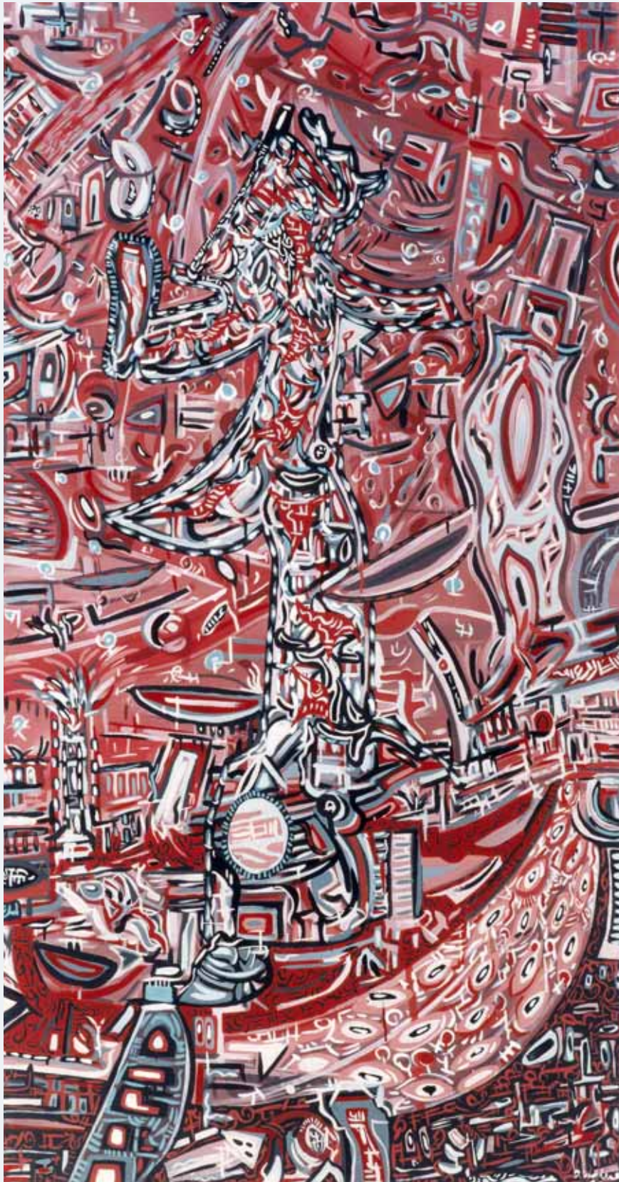
Der König 1986 95 x 180 cm