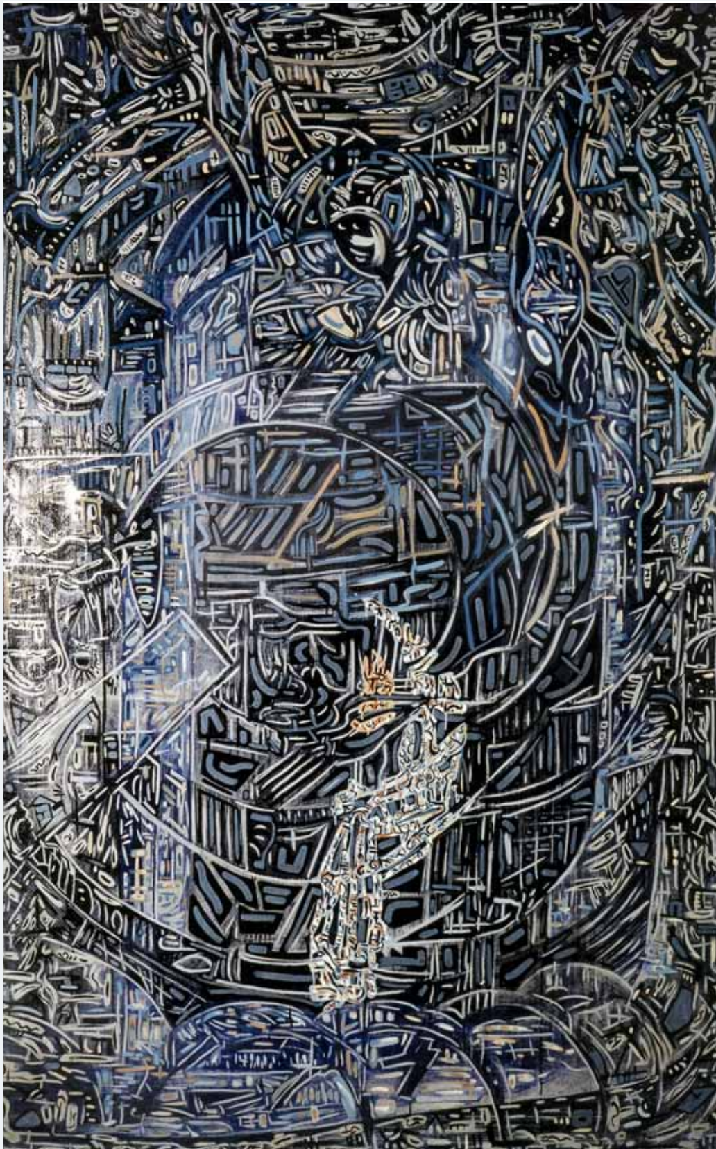
Das Tor 1986 125 x 200 cm Priv.