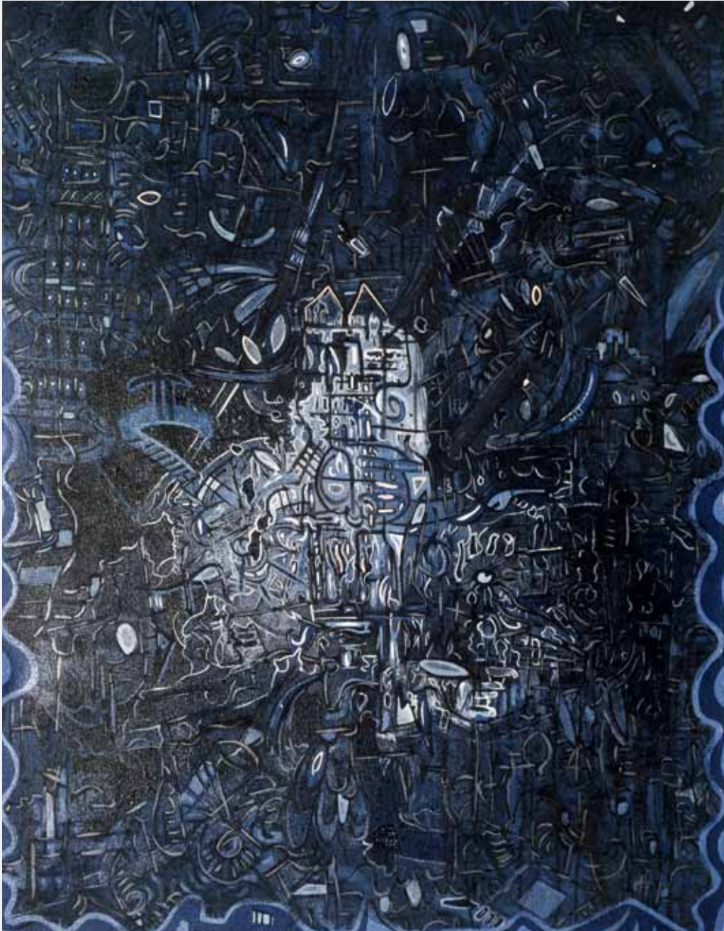
o. T. 1987 90 x 120 cm