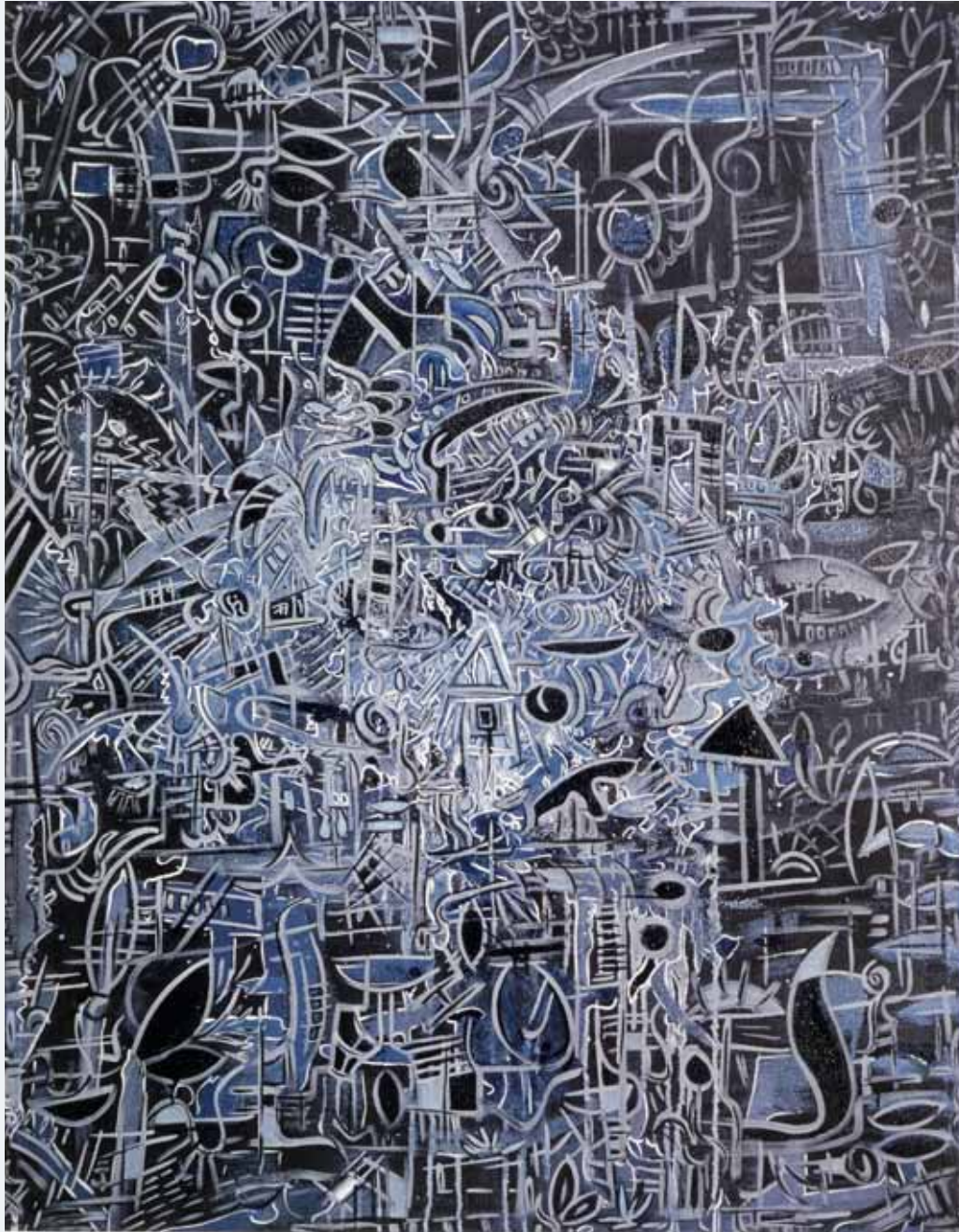
o. T. 1987 90 x 120 cm