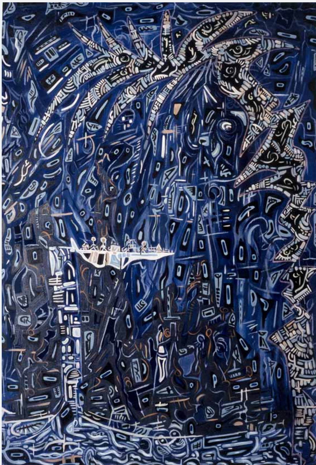
Phantasia 1986 130 x 180 cm Priv.