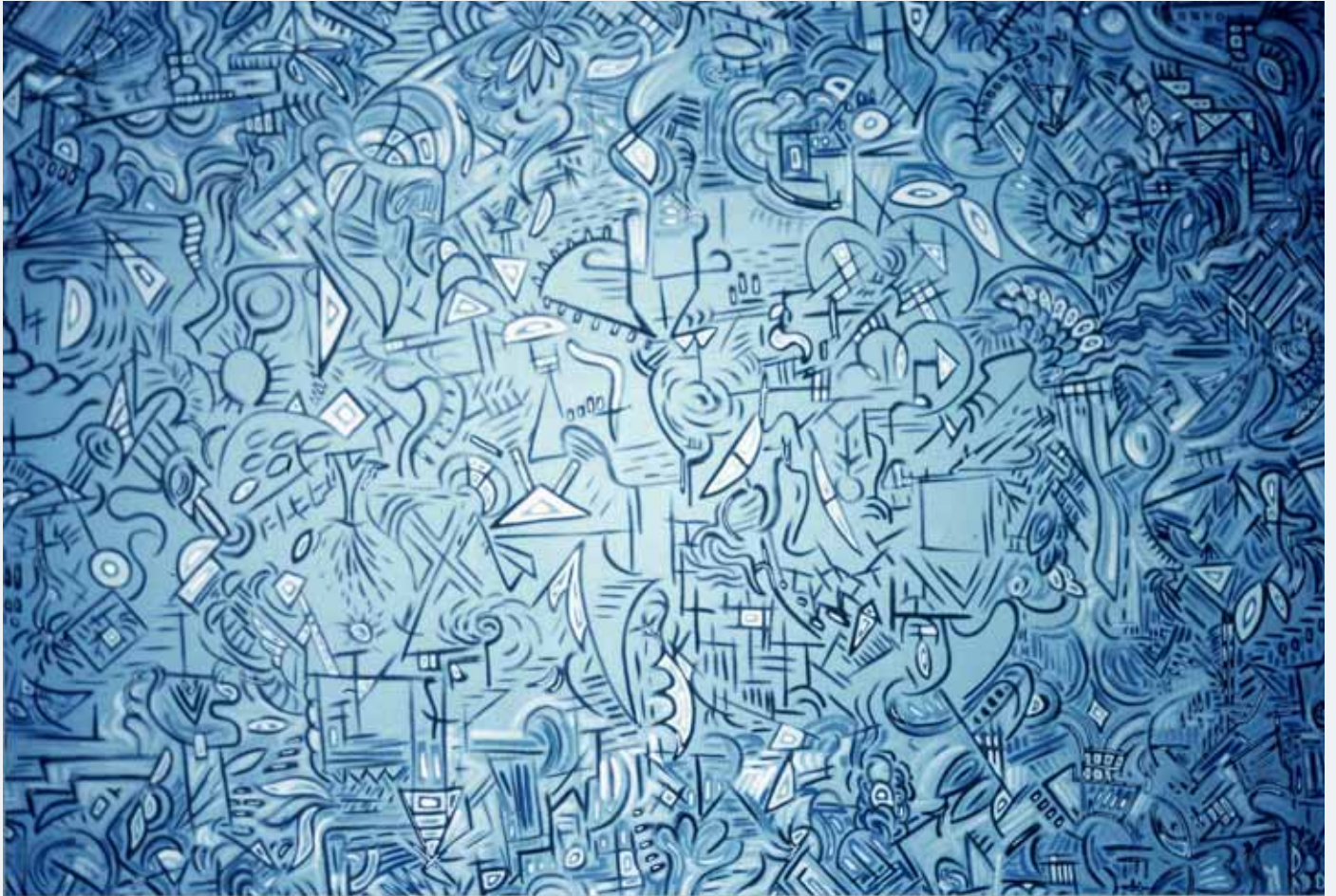
Blue Orchid I 1986 240 x 120 cm Priv.