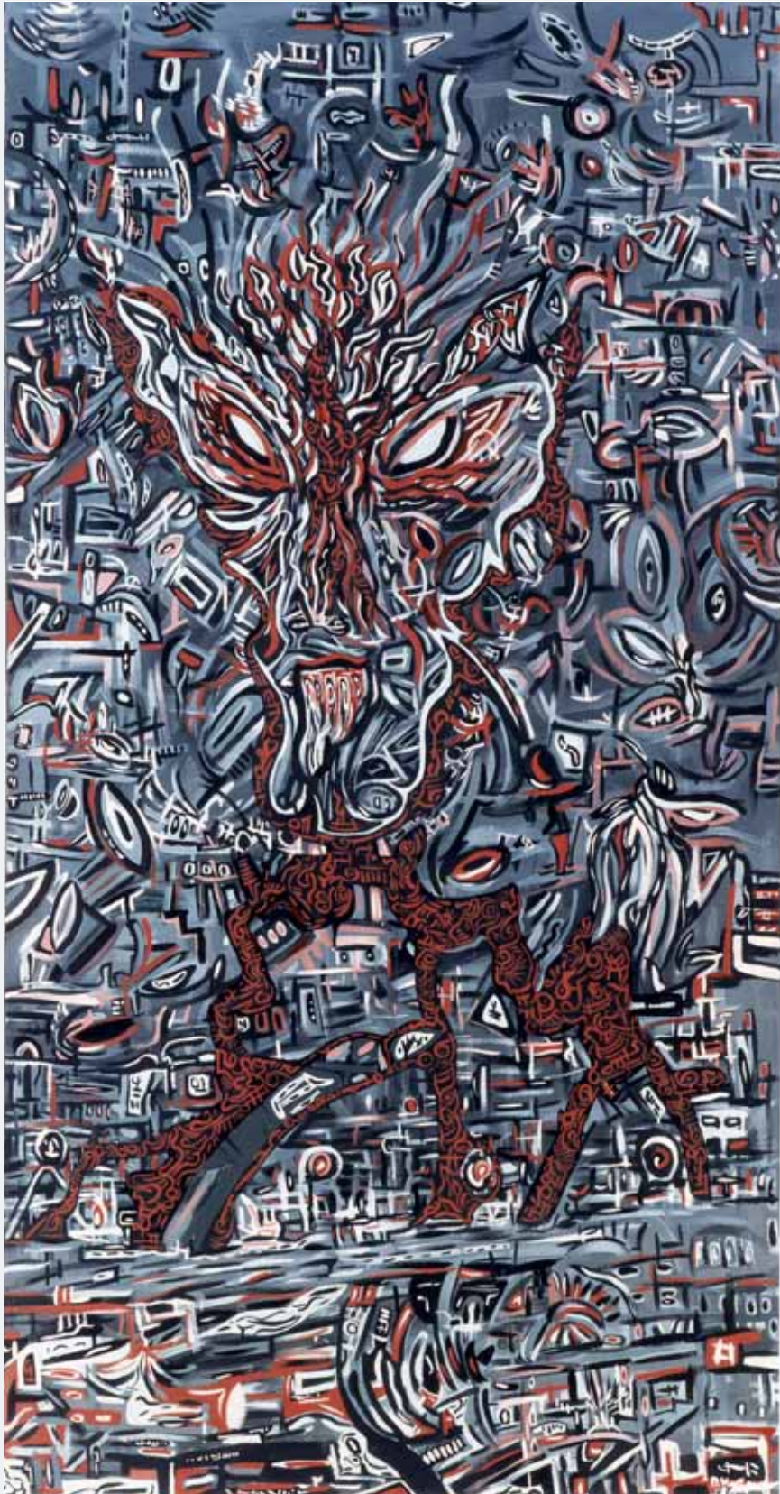
Männlicher Dämon 1986 95 x 180 cm