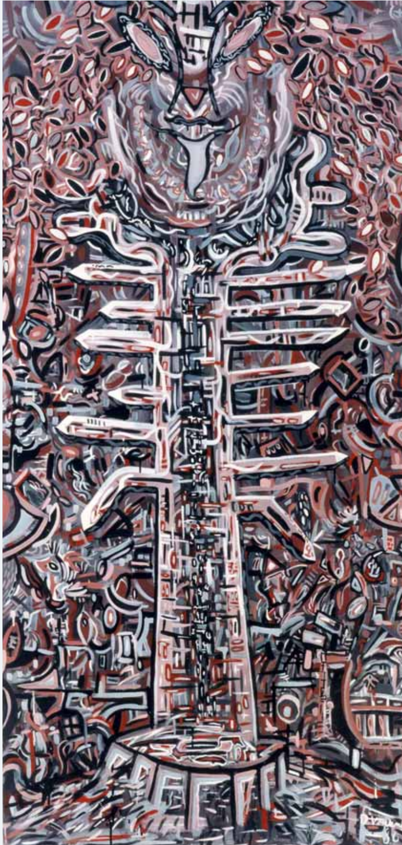
Der Katzengott 1986 80 x 200 cm