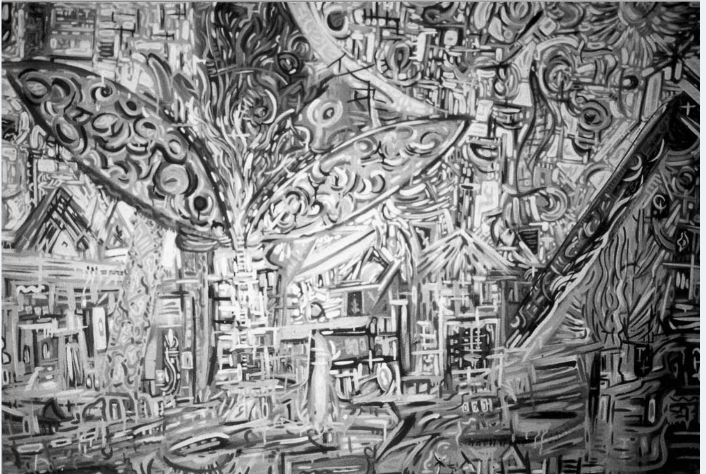
Das Dorf 1986 185 x 120 cm SW Abb. Priv.