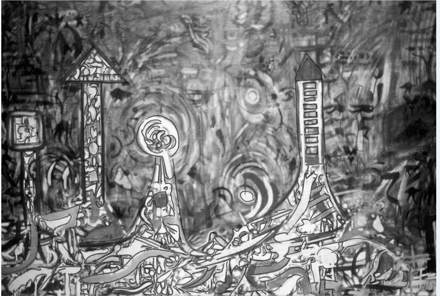
o. T. 1986 150 x 100 cm SW Abb.