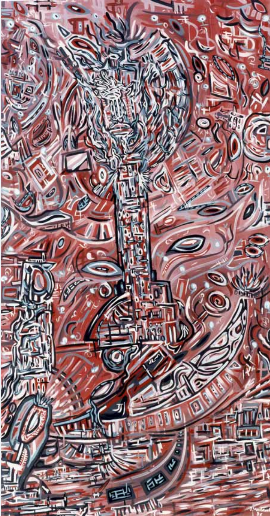
Das Zepter 1986 95 x 180 cm