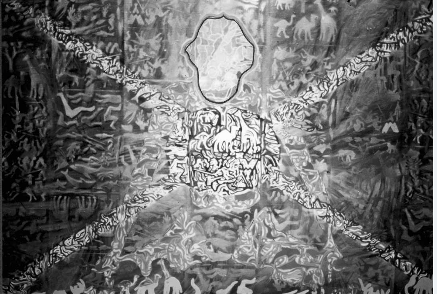
Heartbeat 1986 150 x 100 cm SW Abb.